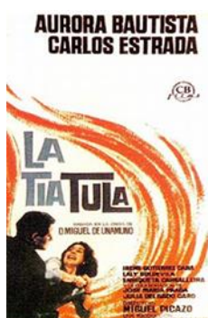
Fig.1.3. Cartel de “La tía Tula”

Películas como “ La tía Tula ” de Miguel Picazo (1964), quien se basó en Miguel de Unamuno, son claro ejemplo de cómo debía asumir su rol la mujer.