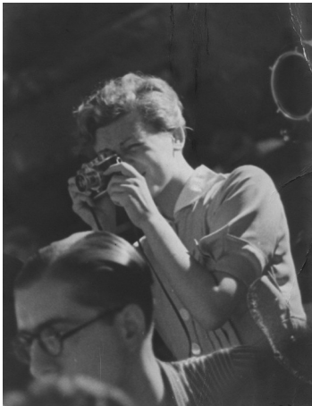
Foto de Gerda Taro, utilizada a modo de montaje en las secuencias 2, 3, 8 y 17.