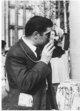
utilizada en la Secuencia 11.