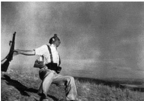
Foto titulada “Muerte de un miliciano” , presumiblemente tomada en cerro Muriano, Córdoba, aunque los nuevos estudios que se han realizado indican que podría estar tomada en la localidad de Espejo (Córdoba) el 5 de Septiembre de 1936, por Robert Capa.