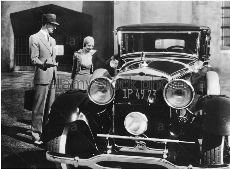
www.alamy.com - B7RC01