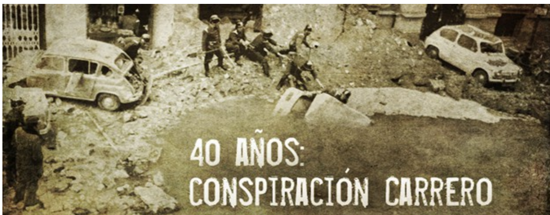
Imagen de archivo del programa 'Cuarto Milenio' acerca de dicha conspiración

Para este trabajo sabíamos que nuestra idea era un tema recurrente en la mayoría de los grupos, dada su naturaleza histórica y de gran relieve en nuestra Historia contemporánea. Por ello, decidimos hacer algo diferente. Acordamos cambiar los protagonistas dejando el mismo proceso, es decir, cambiamos los verdugos. Un comando peculiar de la CIA, en clandestinidad y sin ninguna orden oficial, serían nuestros artífices del atentado. Por tanto, decidimos hacer un contrafactual histórico. A pesar de todo, no es una idea que surgiese de manera espontánea en el grupo sino que echamos manos de algunas conspiraciones que señalaban a la propia CIA norteamericana como culpable de los hechos.